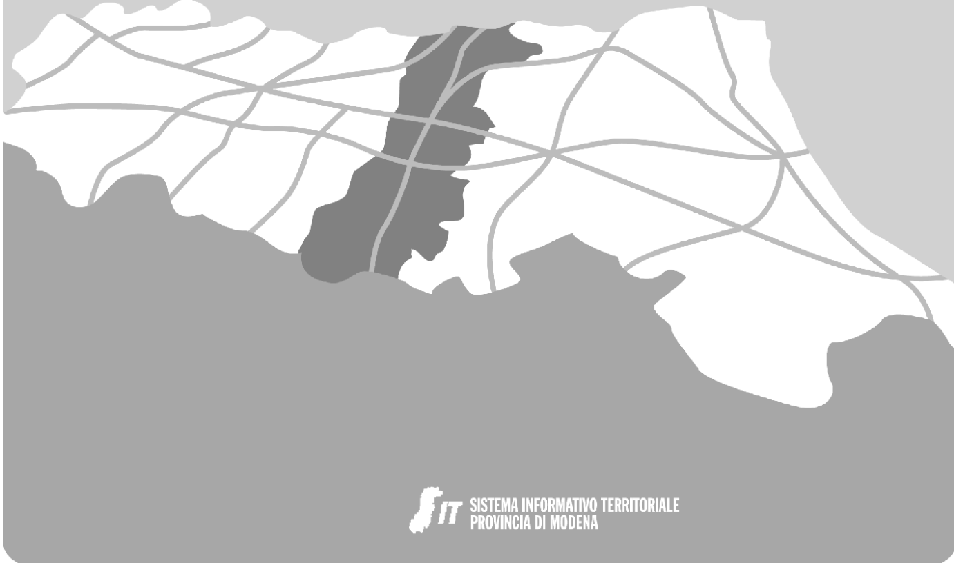
QUADRO D'UNIONE DELLE TAVOLE - SCALA 1:25.000

Approvato con D.C.P. n. 110 del 18/07/2007